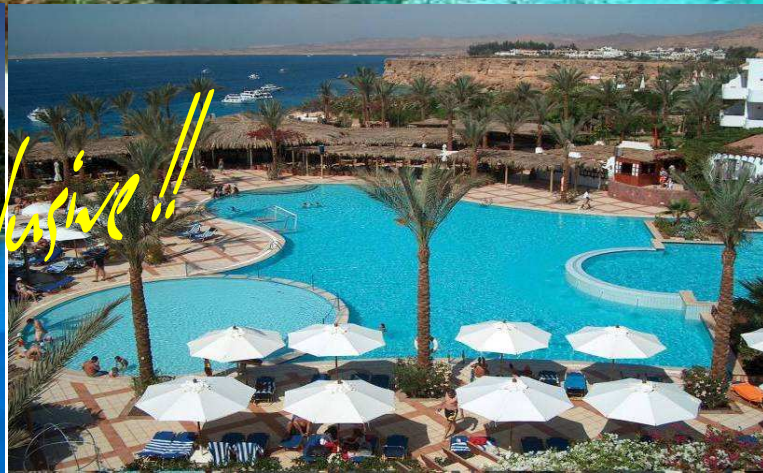
IBEROTEL FANARA ****