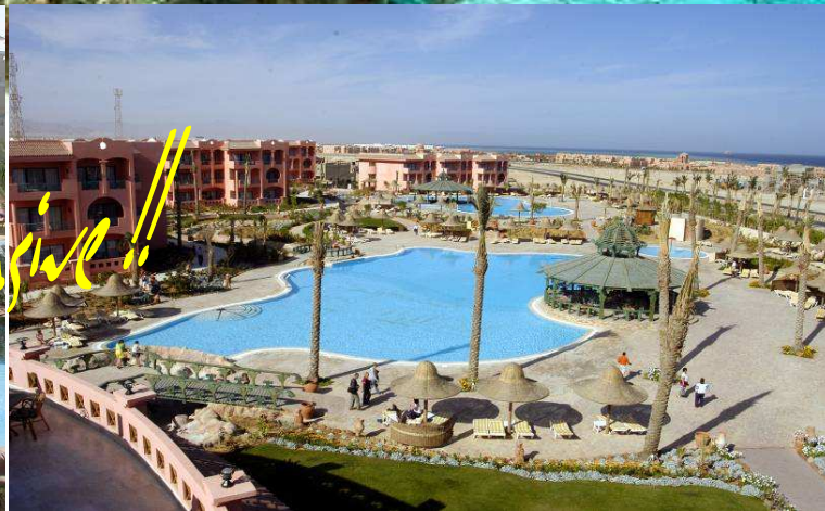
PARK INN ****