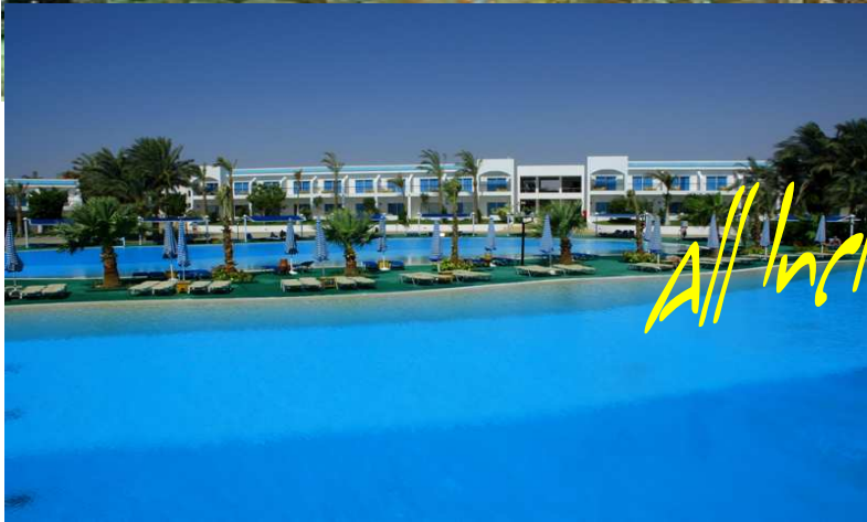
SULTAN GARDENS *****

Offres Vacances d'Octobre Sharm El Sheikh