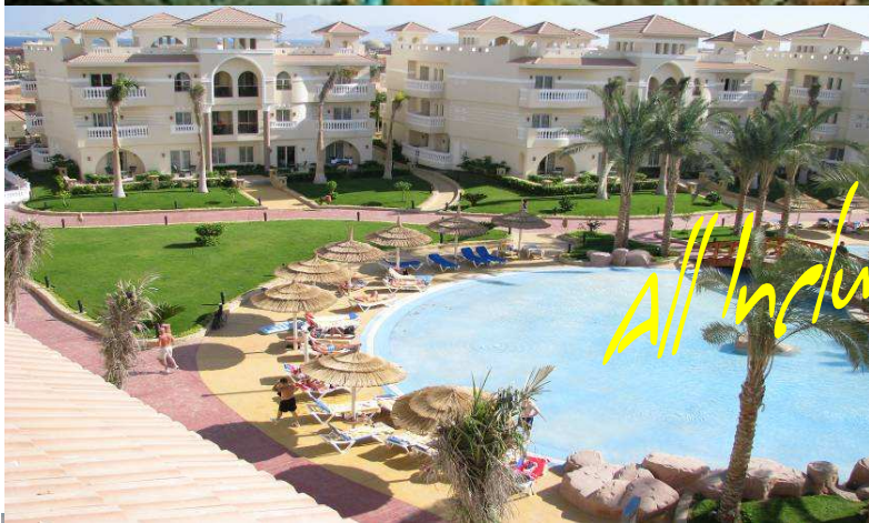
TROPICANA AZURE CLUB ****

Offres Vacances d'Octobre Sharm El Sheikh